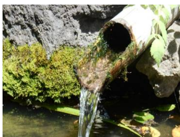
関屋川伏流水による 旧前島家住宅の泉水