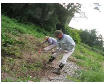
宮崎水門 個人による 緊急工事(令和元年8月)