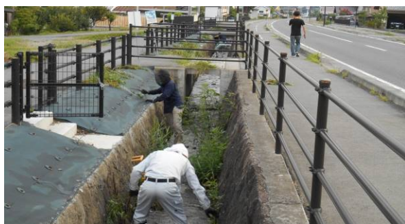
長野真田線松代バイパス西側上荒町水源地