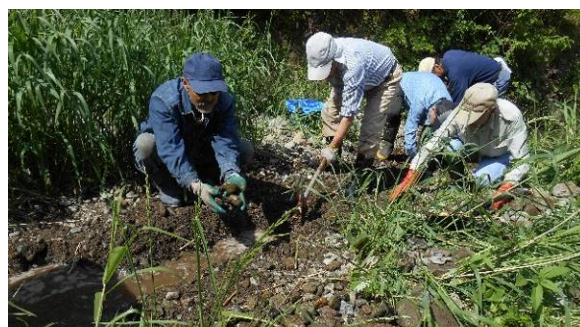
市土木課、泉水・泉水路を守る会役員(令和6年5月)