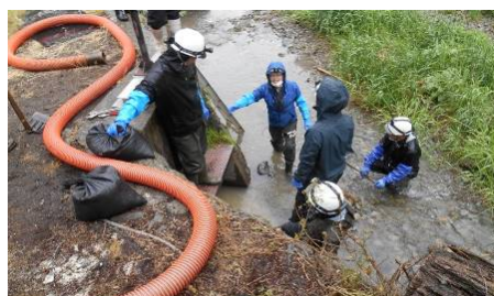
宮崎水門 市土木課、松代の 泉水・泉水路を守る会関屋川部会 役員による工事(令和6年5月)