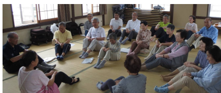
はつらつ体操の様子