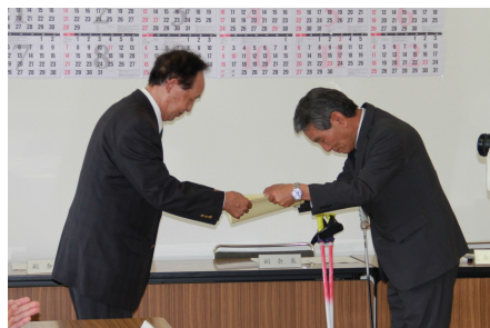
西村住自協会長から感謝状を贈呈