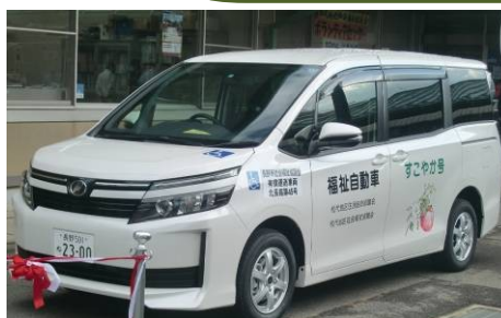
福祉自動車「すこやか号」