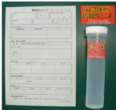
「緊急安心カード」と 「救急医療情報ケース」

松代地区民生児童委員協議会では、一人暮らしのご高齢の皆様の安心・安全な生活を守るため、松代地区住民自治協議会、松代地区社会福祉協議会のご協力を得て、「救急医療情報ケース」を配布します。