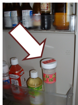
冷蔵庫にケース を保管します

ご不明な点は、松代地区民生児童委員協議会（松代支所内 TEL278-2280）までお問い合わせ下さい。