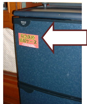
冷蔵庫にマグネット シールを貼付