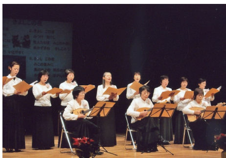
西条グリーンエコーの発表の様子

今回のように、住民参加型の企画も新たに構築し、「松代地区地域福祉大会」を交流事業の一つとして開催する方法を取り入れていきたいと考えておりますので、皆様のご参加とご意見・ご要望をお待ちしています。今後も更なるご協力をお願い致します。