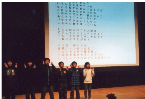
清野小学校3年生の発表の様子

小学生の事例発表は清野小学校3年生の児童のみなさんに「手話交流を通して学んだことをみんなに伝えよう」というテーマで、手話交流を通して自分達にできる大切なこと、手話をする時は表情が大切なこと、学校の総合学習で手話の歴史を調べたことなどを発表していただきました。