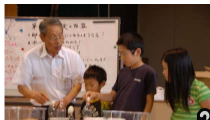
第2回科学教室の様子