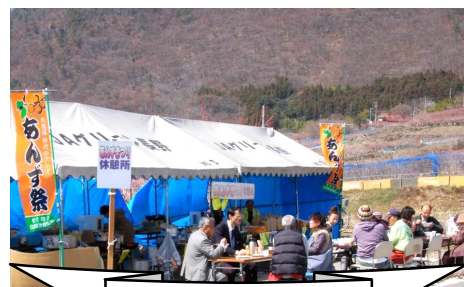
賑わったお休み処

毎年4月初旬、東条の山麓一帯を、鮮やかなピンク色に染め上げるあんずの花を広く紹介しようと、産業部会、東条区長会、地元農業団体が連携して「第1回東条あんず祭り」を開催致しました。4月4日(土)～12日(日)の間、約2270名もの方々がお花見に訪れました。地元の小学生をはじめ、県外の方にもお越し頂き大変賑わいを見せました。あんずの花の美しさ、白銀の北アルプスの眺望、お休み処でのおもてなしに、皆様満足して帰られました。ご協力頂きました関係者の皆様に感謝申し上げます。